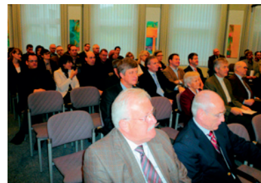
Großes Interesse bei der Preisübergabe